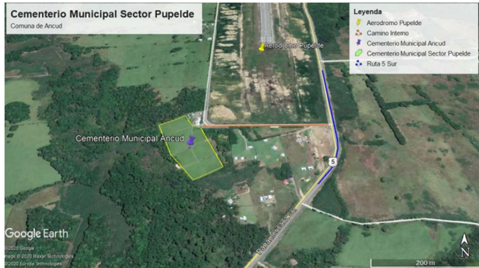
Ilustración 1. Localización del cementerio municipal sector Pupelde, comuna de Ancud.

decir, funcionamiento de un cementerio, ya no particular sino Municipal para la comuna de Ancud.