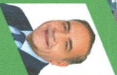
Fidel Espinoza Sandoval , Senador de la República