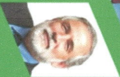
Carlos Montes Cisternas , Ministro de Vivienda y Urbanismo