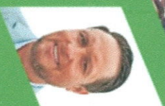
Rodrigo Wainrahgt Gallea , Alcalde de Puerto Montt